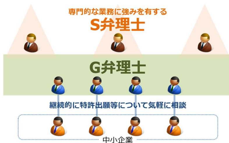
図 2 G 弁理士と S 弁理士の関係

以上述べた G 弁理士と S 弁理士の関係をイメージとして示すと、図 2 のとおりとなる。