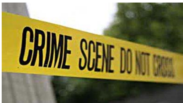
図 3. 差押え現場の規制ライン

模倣品法に基づくレイドの手順を下記のように説明する。前 4 項で説明したように模倣品取引が確認された場合、通常は模倣品取引業者に警告状を送付せずに、レイド手続きを開始する。レイド対応は、警察庁(SAPF)、通商産業省(DTI)が対応する。