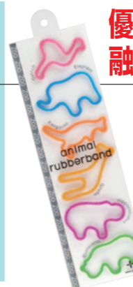
アニマルラバーバンド

動物を型どった「アニマルラバーバンド」は、デザイン性と市場価値を高く評価され、意匠権などを担保として1,000万円の融資を受けた！