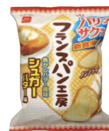
フランスパン工房

パンをスライスして圧縮するという商品。開発過程で生まれたアイデアを特許権で、ユニークなネーミングは商標権で保護し、発売後も好調な売上が維持している！