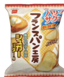
フランスパン工房

パンをスライスして圧縮するという商品。開発過程で生まれたアイデアを特許権で、ユニークなネーミングは商標権で保護し、発売後も好調な売上が維持している！