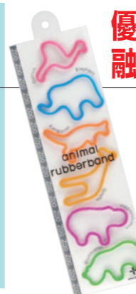
アニマルラバーバンド

動物を型どった「アニマルラバーバンド」は、デザイン性と市場価値を高く評価され、意匠権などを担保として1,000万円の融資を受けた！