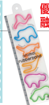
アニマル ラバーバンド

動物を型どった「アニマルラバーバンド」は、デザイン性と市場価値を高く評価され、意匠権などを担保として1,000万円の融資を受けた！