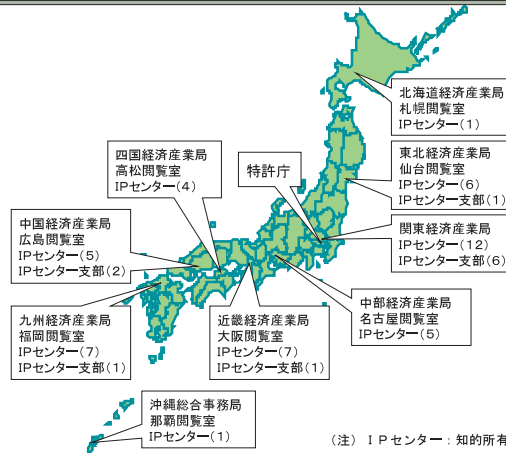
各経済産業局等の特許室、情報館地方閲覧室、知的所有権センターの設置状況

地域における産業財産権の情報提供や活用等、地域ニーズに合わせた支援を行うため、各経済産業局等に特許室を設置しているほか、情報館地方閲覧室、各都道府県の知的所有権センター等を通じて総合的な支援体制を整備している。