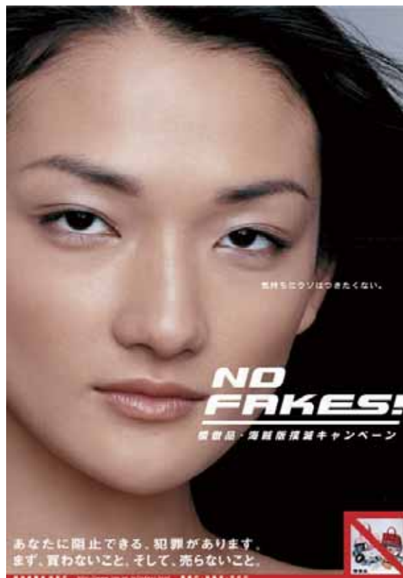
「模倣品・海賊版撲滅キャンペーン」 ポスター&テレビ・スポットCM