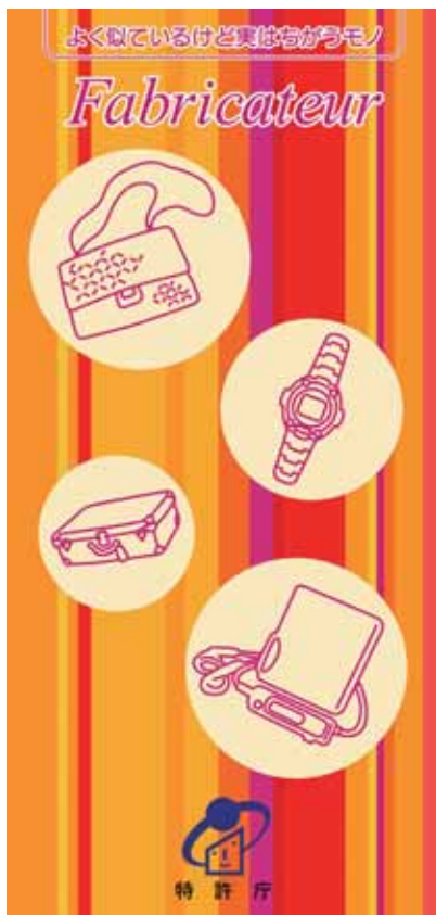
模倣品に関する一般消費者向け冊子

小冊子やインターネット・コンテンツを製作・頒布することにより、善意の消費者の被害を防ぐために模倣品流通の実態について周知するとともに、故意による模倣品購入を防ぐために知的財産権保護の重要性を訴えている。また、『模倣品撲滅キャンペーン』として、ポスターやテレビCMなどを通じた啓発活動を行なっている。