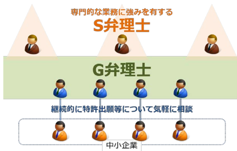
図 2 G 弁理士と S 弁理士の関係

以上述べた G 弁理士と S 弁理士の関係をイメージとして示すと、図 2 のとおりとなる。