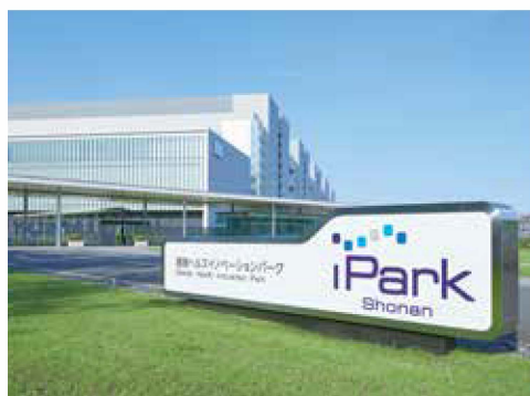
湘南ヘルスイノベーションパーク(神奈川県藤沢市)