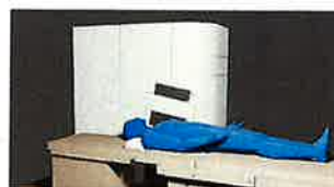
本格的な共同研究に基づく新たな価値創出 (脊髄誘発磁場計測システム)