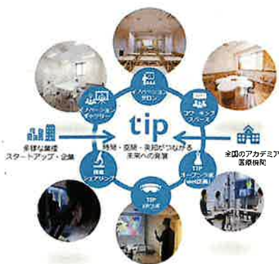
多様な業種・業界の 企業・スタートアップとの 異分野連携増強のための仕組み 「TMDU イノベーションパーク(TIP)」