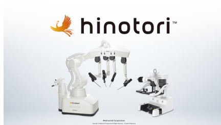
hinotori™ サージカルロボットシステム