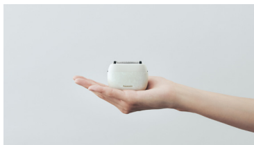
シェーバーの当たり前を見直して 生まれたラムダッシュ パームイン