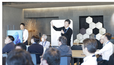
経営者主導による デザイン経営実践プロジェクト