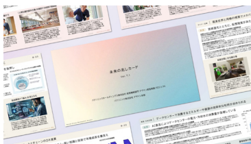
未来起点・人間中心の思考を促す 未来の兆しカード