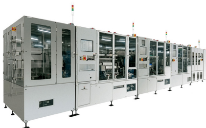
ボールマウンタライン。 ウエハやプリント基板へのフラックス印刷・ ボール搭載・検査リペアを全自動で行う