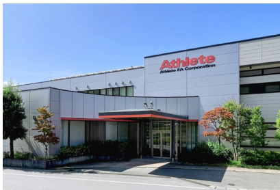
アスリート FA 本体外観