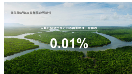
酵素を生み出す微生物には無限の可能性がある