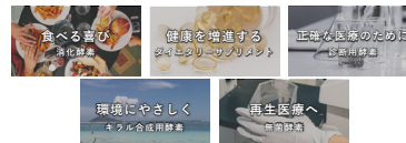
酵素は多様な産業・用途で顧客価値を提供している