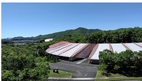
酵素の研究を行うイノベーションセンター