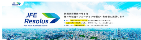
JFE Resolus® ウェブサイトフロントページ https://www.jfe-steel.co.jp/products/solution/index.html