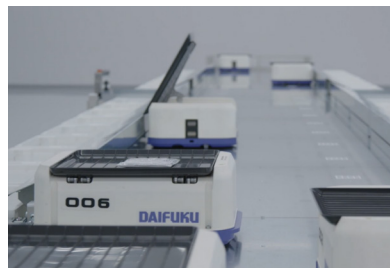
トレイを左右両方向へ傾ける事で通路両側のシュートに投入可能な「SOTR-S」