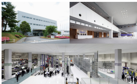
当社のマテハン・ロジスティクス体験型総合展示場「日に新た館」