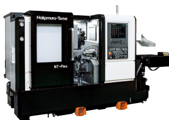
「NT-Flex」コンパクトで高い性能を実現