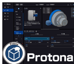
「Protona」対話型 NC プログラミングソフトウェア