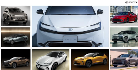
トヨタブランドにおけるハンマーヘッドデザイン