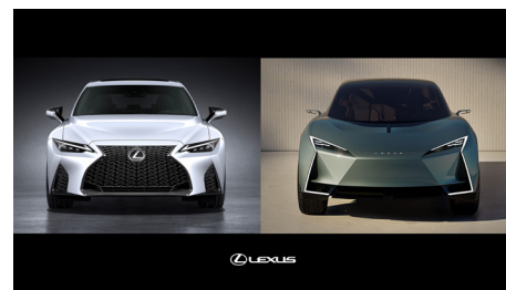
レクサスブランドにおけるスピンドルボディデザイン