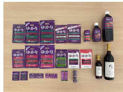
「ゆかり®」シリーズ商品