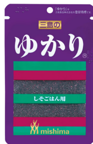
赤しそふりかけ「ゆかり®」