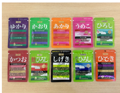
人のお名前のようなシリーズ商品