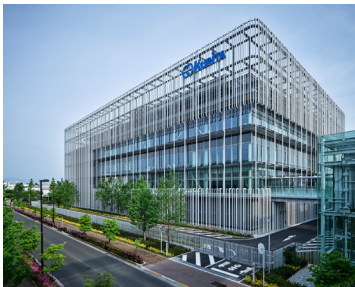
オープンイノベーションの中核拠点 [Kurita Innovation Hub]