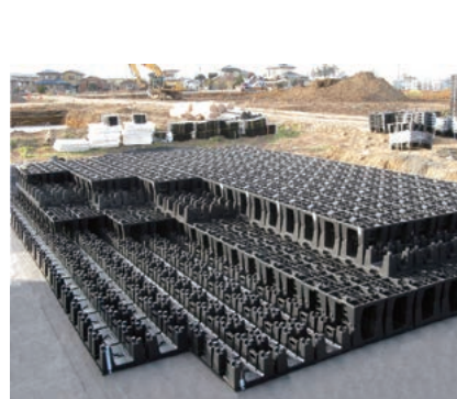
建築土木資材(雨水貯留浸透槽)