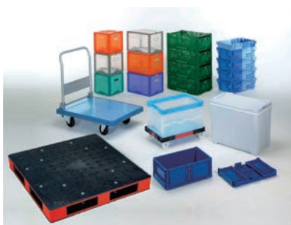
物流産業資材(コンテナ・パレット等)