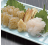
富山県 富山湾のシロエビ