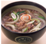
石川県 小松うどん