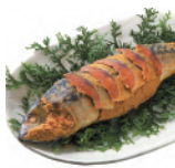
福井県 美浜のへしこ