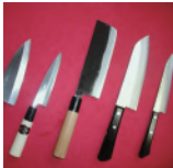
福井県 越前打刃物