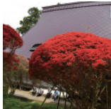
石川県のと麒麟マツジ