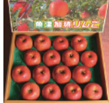
富山県 加積りんご