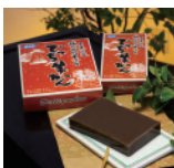
福井県 越前おおいでっちゃん