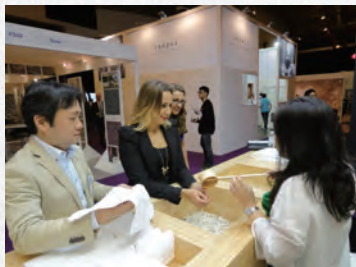
▲イギリスの展示会の様子。

A. 中国、台湾、韓国、インドネシア、シンガポールですでに商標登録済みです。販売の多いアジアを中心にしています。欧米にはロゴマークのみ出願しています。