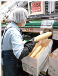
▲海外向けの白い箱に詰められる十勝川西長いも。輸出では大型(1450g以上)が好まれる

東日本大震災以降、海外に輸出する際には産地証明が必要になり、その手続きに手間取ることがありました。台湾に輸出する際、 地域団体商標の登録証が「日本国が認めた産地証明」として効果を発揮し、通関をスムーズに通過できました。