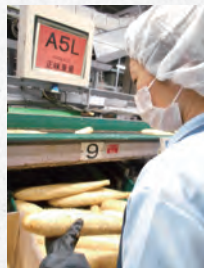
▲品質のチェックは厳しく行っています。

また、海外への輸出が本格化するなか、海外での名称保護を目的として6か国に 商標出願 しました。うち5か国で権利化しており、 名称の模倣について抑制効果がある と感じています。シンガポール、タイへの出願の際には、 特許庁の外国出願補助金を活用 しました。