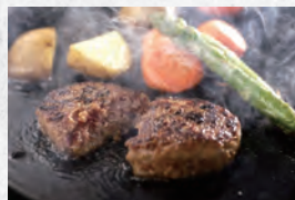
▲冷凍十勝若牛ハンバーグ