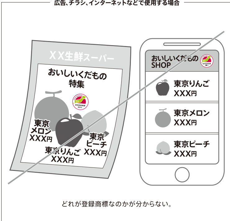
広告、チラシ、インターネットなどで使用する場合