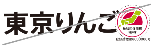
文字が保護エリアを侵している