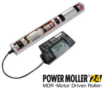
搬送コンベヤのIoTを実現する モータ内蔵ローラ「パワーモラ」