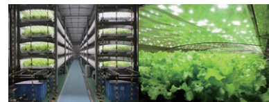
省エネ・簡単設置 新時代の植物工場システム 「セル式モジュール型植物工場」