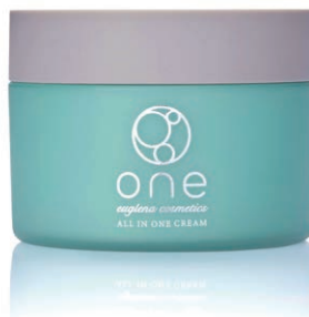
ユーグレナ入り化粧品「one(ワン)」