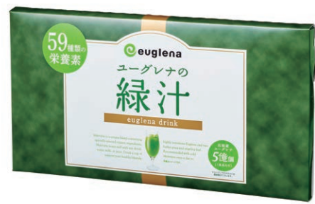
ユーグレナ入り食品「ユーグレナの緑汁」