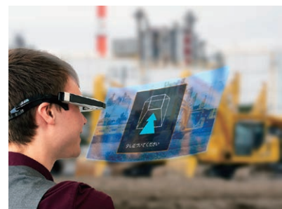
世界で初めて遠隔作業支援専用スマートグラスを開発し、遠隔から作業支援ができる仕組みを開発 ※2015年8月時点。オプティム調べ