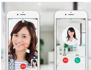
日本で初めてスマホを使った遠隔診療サービスを開発・提供 ※2016年7月時点。オプティム調べ