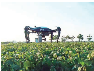
世界で初めてドローンの空撮画像を人工知能が解析するプラットフォームを開発・提供 ※2015年8月時点。オプティム調べ